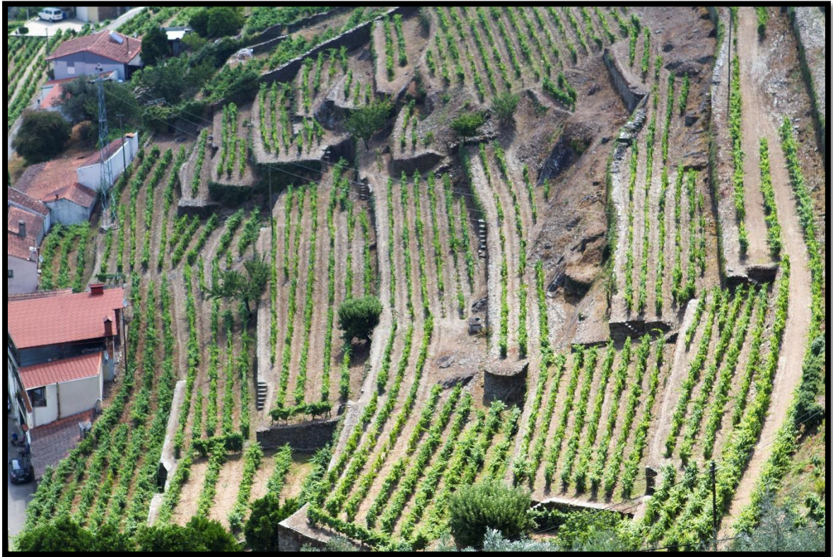
Foto 2 - Rechteroever Douro