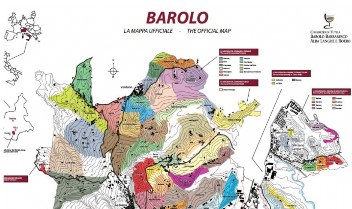
Afbeelding: screenshot van de MeGa app voor Barolo