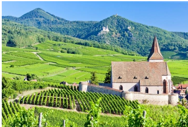
Landschap Elzas

De wijngaarden van de Elzas zijn één van de noordelijkste van Frankrijk en van heel Europa. Zij liggen verspreid over 119 gemeenten in de departementen Bas-Rhin en Haut-Rhin. Het wijngebied is slechts enkele kilometers breed en de wijngaarden strekken zich uit over een lengte van 120 kilometer, van Marlenheim ter hoogte van Straatsburg tot Thann in het zuiden, met nog een kleine enclave in het hoge noorden rond Cleebourg. De wijngaarden bestaan uit smalle stroken, die verspreid liggen over een groot aantal heuvels op 200 tot 400 meter hoogte. De lengte ervan varieert van 1,5 tot 3 kilometer. Algemeen wordt gezegd dat Haut-Rhin meer en betere wijnen oplevert dan Bas-Rhin. In hoofdstuk 2.7.2 kan er een kaart van de wijngaarden gevonden worden.