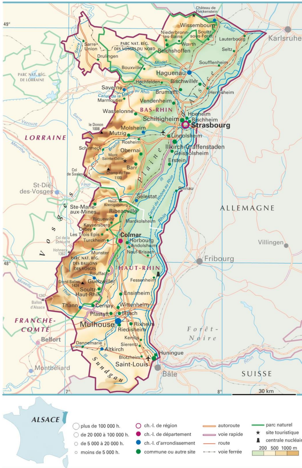
Kaart Elzas

De Elzas is 190 km lang, 50 km breed en heeft een oppervlakte van 8280 km 2 die een grote afwisseling in landschappen biedt: bossen, valleien, vlaktes, heuvels, etc. De hoofdstad is Straatsburg. De regio maakt na de regionale herindeling per januari 2016 deel uit van de regio Alsace-Champagne-Ardenne-Lorraine.